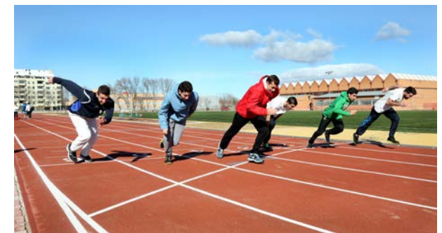
Pista de atletismo