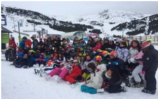
Viaje de Esquí a Andorra (Enero 2017)

El objetivo primordial que perseguimos es el de fomentar y desarrollar en los alumnos las actividades deportivas y su práctica habitual. Buscamos los beneficios que el deporte proporciona en el ámbito de la salud, el ocio y la socialización.