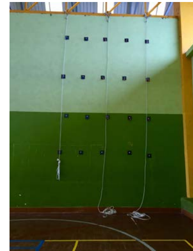
Pabellón Polideportivo. Rocódromo y escalada.