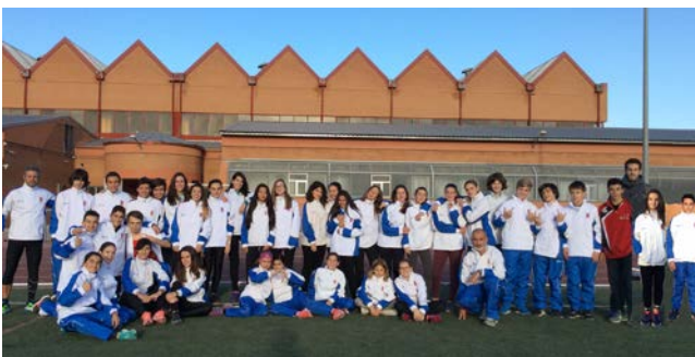
Componentes Escuela de Atletismo (2017/18)