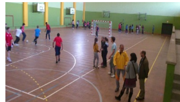
Pabellón Polideportivo. Visita alumnos Islas Reunión (2013)