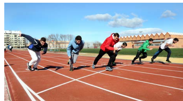
Pista de atletismo