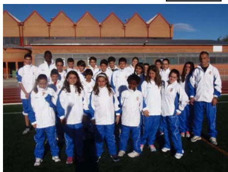
Componentes Escuela de Atletismo (2013/14)