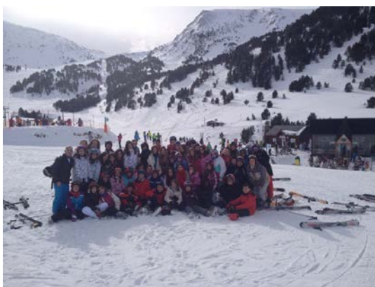
Viaje de Esquí a Andorra (Enero 2014)

El objetivo primordial que perseguimos es el de fomentar y desarrollar en los alumnos las actividades deportivas y su práctica habitual. Buscamos los beneficios que el deporte proporciona en el ámbito de la salud, el ocio y la socialización.