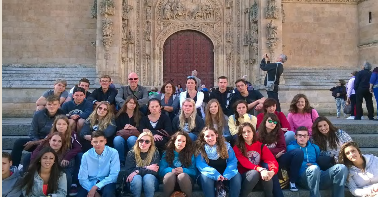
Visit to the cathedral and the Ieronimus Towers