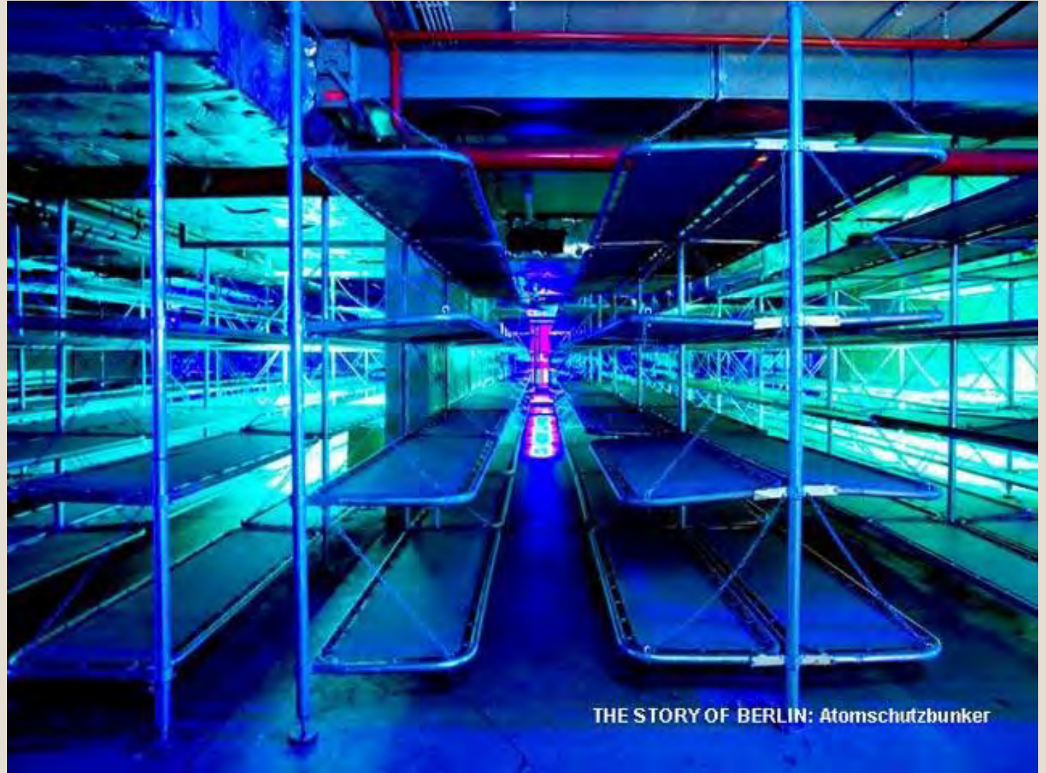
THE STORY OF BERLIN: Atomschutzbunker

It could host 3500 people during 40 days. Plus, we also listened a real bombing, which really impressed us.