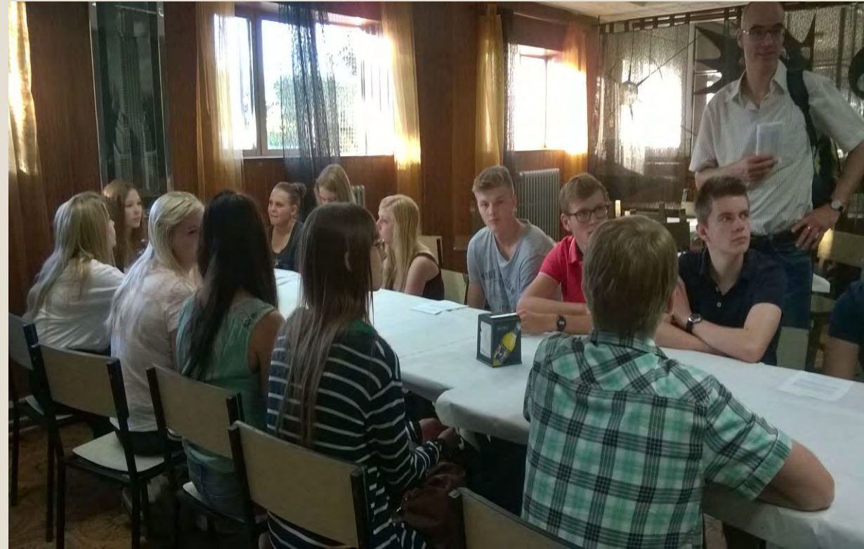
The German students visited our school.